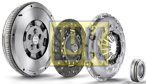
Generic image for illustration purposes only